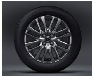
16" aluminiumsfælg til Mazda2 COSMO