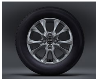
15" aluminiumsfælg til Mazda2 SKY