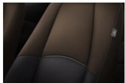
Sort og brunt stof til Mazda2 SENSE og SKY